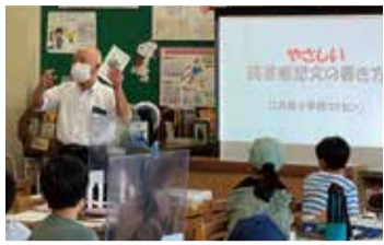
いつも大好評 本に囲まれた図書室で45名の参加