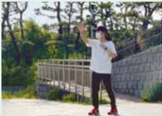
江井島海岸展望台で稽古中

そして今では劇団ひまわりで役者として稽古に励んでいます。物語に触れるということ自体が好きで、生涯役者を続けられればと考えています。小説、漫画、ドラマ、アニメ、映画、演劇、何でも観ます。誰が何に触れ、何を感じて、どう行動するのか、何を伝えたいのか。誰かの身体を借りて、それらを考えながら、色んな世界を渡り歩く。それがとても楽しいです。