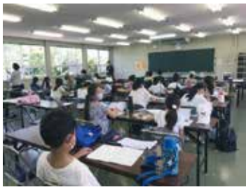
7/23日から4日間延べ236名の参加