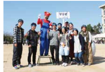
細田小学校長「マリオ!」