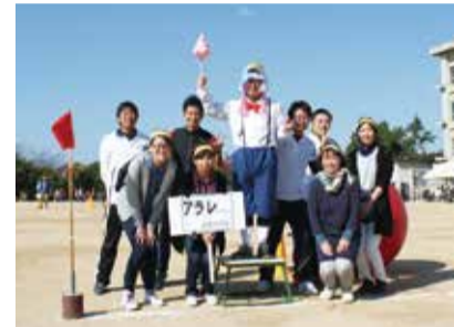
永田中学校長「アラレちゃん!」