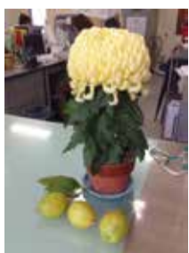
皆さまのご厚意で受付に季節の花など

地域住民が管理運営を担う 江井島小学校校コミセンの運営と管理を江井島コミュニティ推進協議会が担うことになりました。現在、地域採用の、地域事務局長2名(現在は1名欠員)が、まちづくりの事務を行い、市職員4名が小学校校コミセンの運営及び施設管理などを行っています。