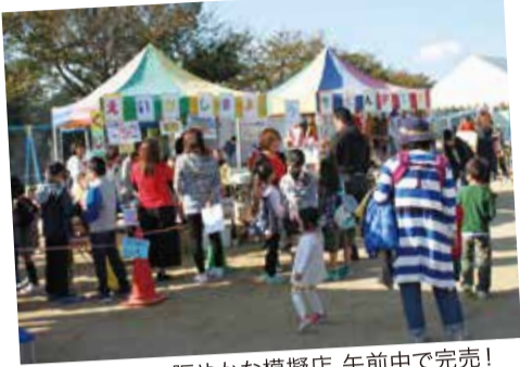
賑やかな模擬店 午前中で完売!

江井島中学校の吹奏楽部のオーブニング演奏のあと、玉入れやパン食い競走など9種類の競技と抽選会がありました。恒例となった、PTA競技「着せ替えレース」は変身した園長先生、校長先生に拍手喝采でした。抽選会では地元産のお米30キロや小芋、さつまいも、枝豆、見事な焼き鯛、大きなゆでタコ、