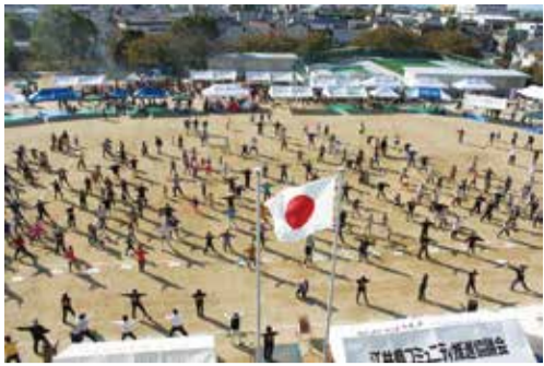
明石焼き体操でスタート