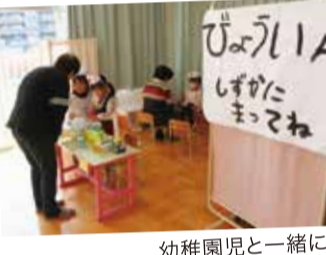
幼稚園児と一緒に