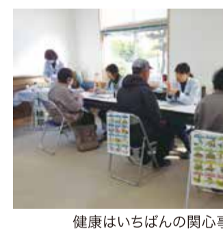
健康はいちばんの関心事