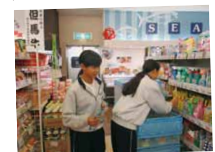
商品の陳列も難しい…スーパー