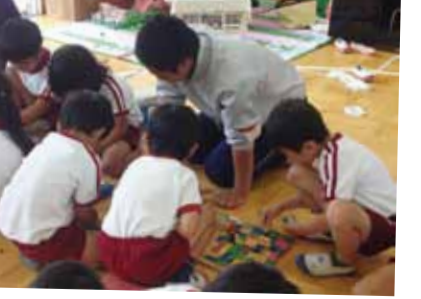
お兄ちゃんと遊ぶ園児…幼稚園