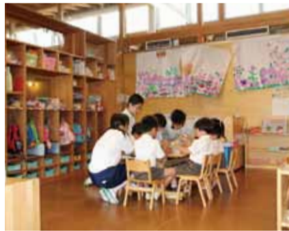
お姉ちゃん・お兄ちゃん先生・保育所