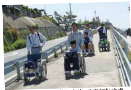
車いすでの西江井～魚住・住吉神社往復