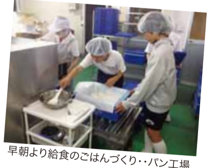
朝食より給食のごはんづくり…パン工場