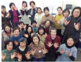
夢文庫・ふれあい喫茶スタッフ