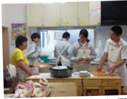
コーヒーとケーキの準備…小コミふれあい喫茶